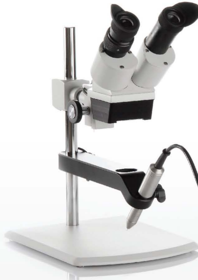
(Abb. PUK 3 mit mezzo-Stereomikroskop)

Die Impulszeit wird im Display mit "Ti" (time) angezeigt. Die Standardzeit sind 7 Millisekunden (ms). Auch beim "Puk 2" kann man mit dem "Impuls-Knopf" die Impulszeit einstellen, "Impuls I" entspricht ~7ms, "Impuls II" ~18ms.