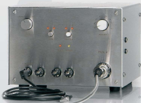
(Abb. PUK 2)

In der Praxis werden die meisten Schweißungen entweder mit der Standardzeit von 7ms (Impuls I), oder mit möglichst kurzem Impuls gemacht.